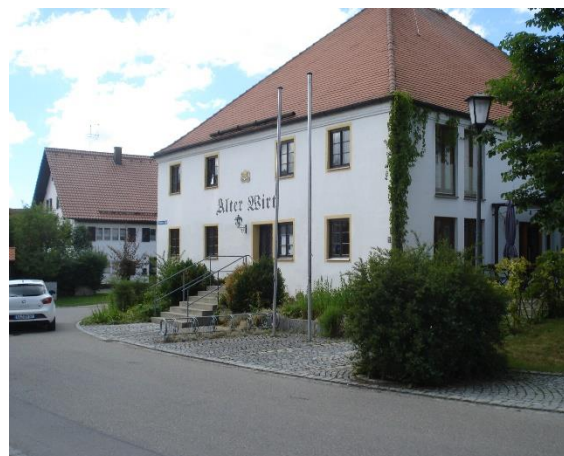
Abb. 2 Sonderbauform, Alter Wirt

Daneben bestehen für besondere Nutzungen, wie Wirtschaft, Schule, Pfarrhaus besondere Bauformen, die sich zumeist durch ein weniger großes Längen-Breitenverhältnis des Grundrisses und besondere Dachformen (z.B. Walmdach) auszeichnen.