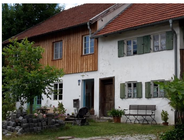
Abb. 3 Typische Bauform, Stallteil als Wohnhaus umgenutzt, Mittlere Dorfstraße 3

Die Austragshäuser für den Altenteil sowie die Kleinbauernhäuser wurden dagegen zwar in der regionaltypischen Bauweise mit Satteldach, jedoch zumeist eingeschossig ausgeführt.