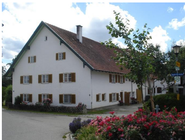
Abb. 1 Typische Bauform, Kaspar-Ett-Str. 7