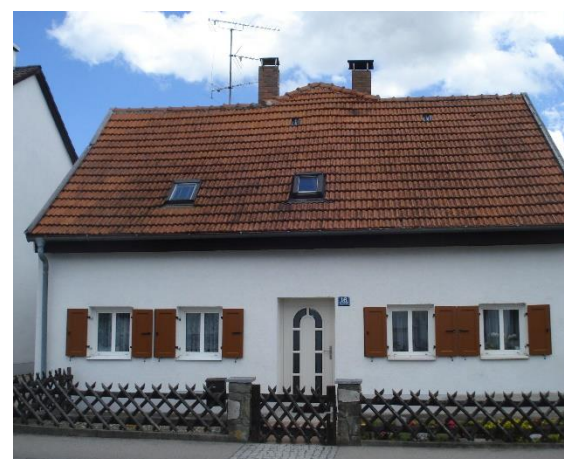
Abb. 4 Ehemaliges Austragshaus, Hauptstraße 16